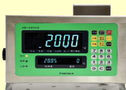
プリンター付指示計